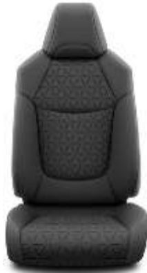
Sitzbezug Stoff schwarz