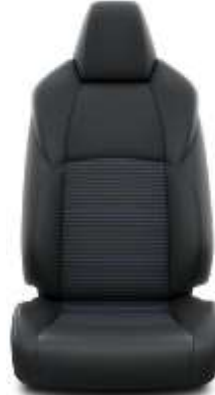
Sitzbezug Teilleder schwarz