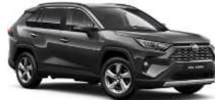
1G3 Ash Grey Metallic