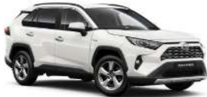
040 Pure White