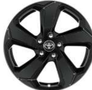
18" Leichtmetallfelge 5 Speichen schwarz