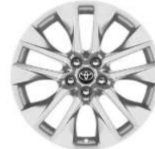
19" Leichtmetallfelge 5 Doppelspeichen silber