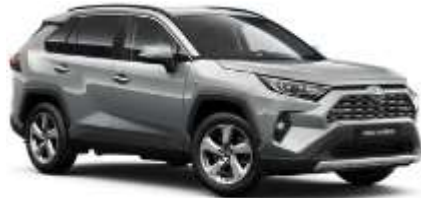
1D6 Zircon Silver Metallic