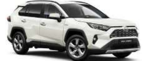
070 Pearl White Metallic