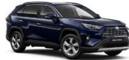
8X8 Midnight Blue Metallic