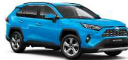
8W9 Cyan Metallic