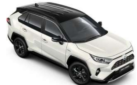
2QJ Pearl White Metallic/Black