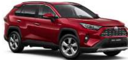
3T3 Tokyo Red Metallic