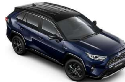
2RA Midnight Blue Metallic/Black