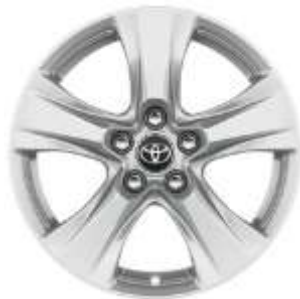
17" Leichtmetallfelge 5 Speichen silber