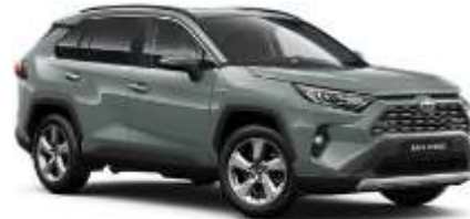
6X3 Urban Khaki