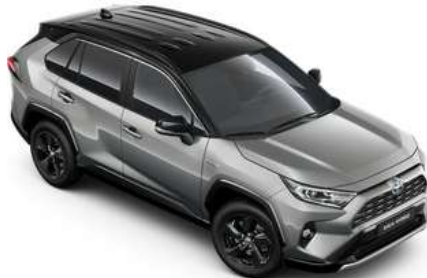
2QY Zircon Silver Metallic/Black