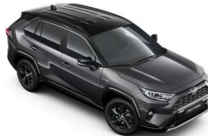
2QZ Ash Grey Metallic/Black