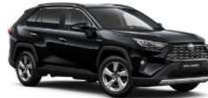
218 Attitude Black Metallic