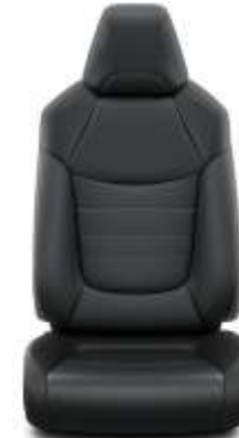
Sitzbezug Leder schwarz (20)